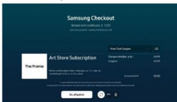
7. De coupon is nu automatisch gekoppeld aan je account. Klik op "Nu afspelen".