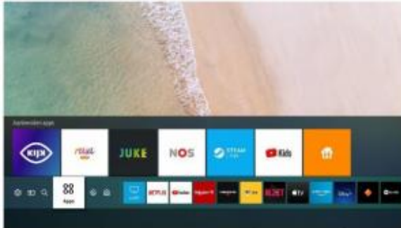
1. Ga naar het Smart TV overzicht en open de apps.