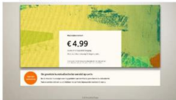
5. Ga naar de Art Store en klik op "Aanmelden met een coupon".