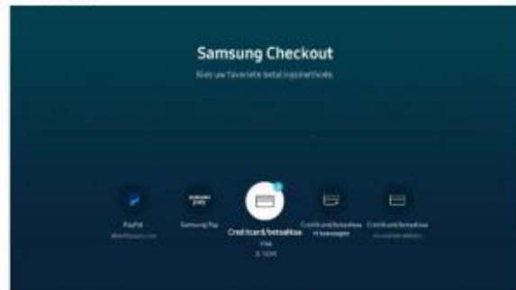
6. Kies een betaalmethode voor na de drie maanden proefperiode.