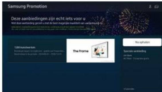
3. Selecteer de Art Store promotie en klik op "Nu ophalen".