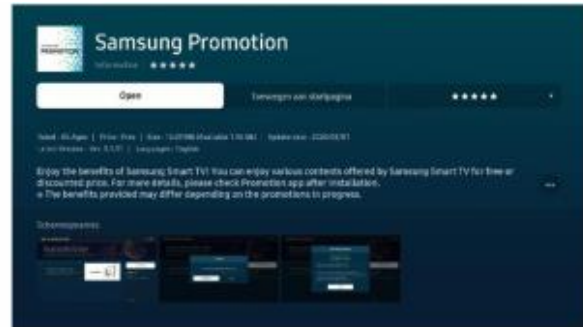
2. Download en open de "Samsung promotion" app.