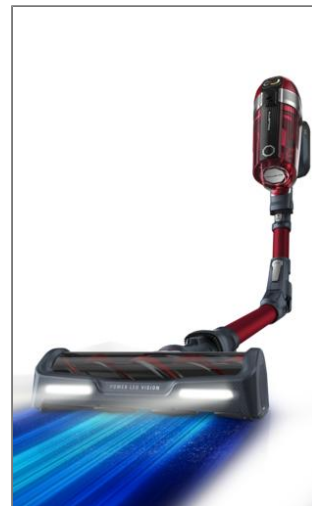
X-FORCE FLEX 11.60 RH9879WO XFORCE FLEX 11.60 ANIMAL CARE RH9879WO