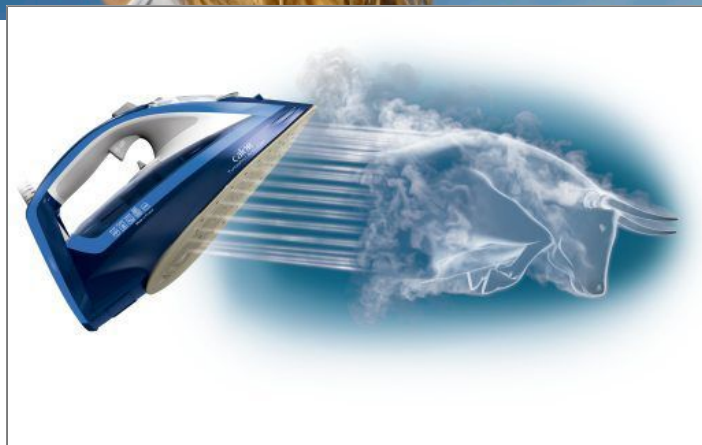
TURBO PRO ANTI-CALC FV5630 Stoomstrijkijzer TurboPro Anti-calc FV5630C0