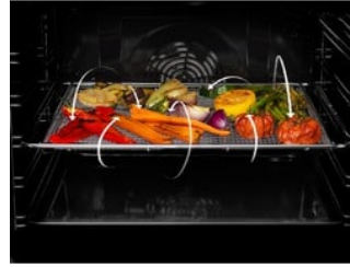
Vitrokeramische kookplaat en multifunctionele heteluchtoven, 60cm, AirFry, inox