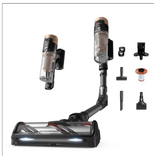
X-Force Flex 14.80, draadloze steelstofzuiger, extra zuigkracht 240 Airwatt, extra lange gebruiksduur RH9B74WO Extra vermogen, onverslaanbare looptijd RH9B74WO