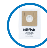
1 sac hygiène inclus