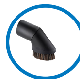
Brosse meuble 82215000