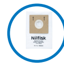
Sacs hygiène «+ Bag» 78602600