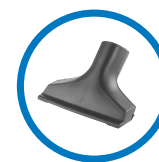
Embout ventouse 82214900