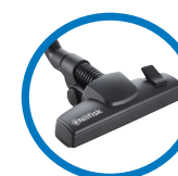
Brosse sols combinée 128389012