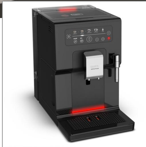
INTUITION ESSENTIAL EA870810 EA870810