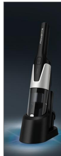
ASPIRATEUR SANS FIL AC97 ASPIRATEUR À MAIN X-TOUCH AC9736WO